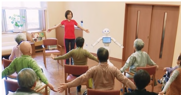
【「Pepper 版ゆうゆう体操」の実施風景】